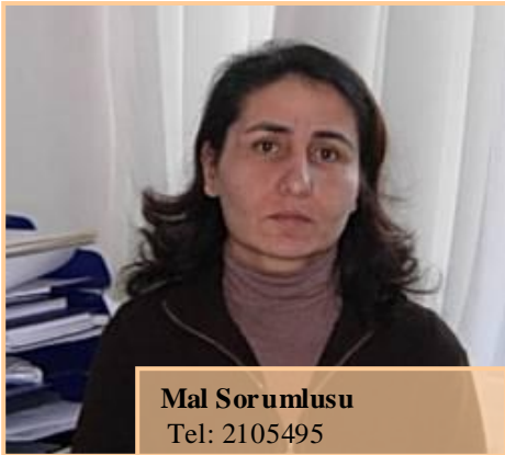
Mal Sorumlusu Tel: 2105495 ozsemra@metu.edu.tr