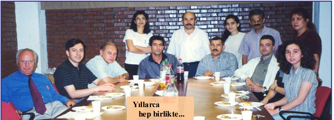
Yıllarca hep birlikte...

Sebay Bey Öğrenci İşleri Ofisi (Student Affairs Office) tarafından yapılan birçok duyuruyu http://sao.ce.metu.edu.tr sayfası aracılığıyla sunmaktadır. Bu sayfada, her dönem güncellenen öğrencilerin sıralaması, sınav tarihleri, ders programları, açılan dersler, danışman programı, bölümümüzde (öğrenciler için) kullanılan formlar, doktora sınavı uygulamaları, ortalama hesabı, teknik olmayan seçmeli dersler (NTE dersleri) (Mühendislik Fakültesi Dekanlığı sayfasına yönlendirme) hakkında bilgi bulabilirsiniz.