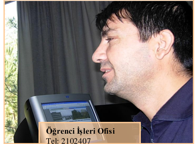
Öğrenci İşleri Ofisi Tel: 2102407 sebay@metu.edu.tr

1996'dan beri bölümümüzde Öğrenci İşleri Ofisi sorumlusu olarak çalışmaktadır. Yeni açılacak dersler, stajlar, yandal, yatay ve dikey geçiş gibi konulardaki yazışmalarda dersler ve öğrenciler ile ilgili konulardan sorumludur. Bu konularda Mühendislik Fakültesi Dekanlığı, Fen Bilimleri Enstitüsü ve diğer bölümlerle yapılan yazışmaları da yürütmektedir. Ayrıca yeni açılacak derslerin Öğrenci İşleri Bilgi Sistemine (OİBS) tanıtımının aktarılması, danışman atamaları, sınav programı sisteminin kullanılmasından; sınavlara gözetmen atamalarının ve sınav yeri kontrolünden sorumludur.